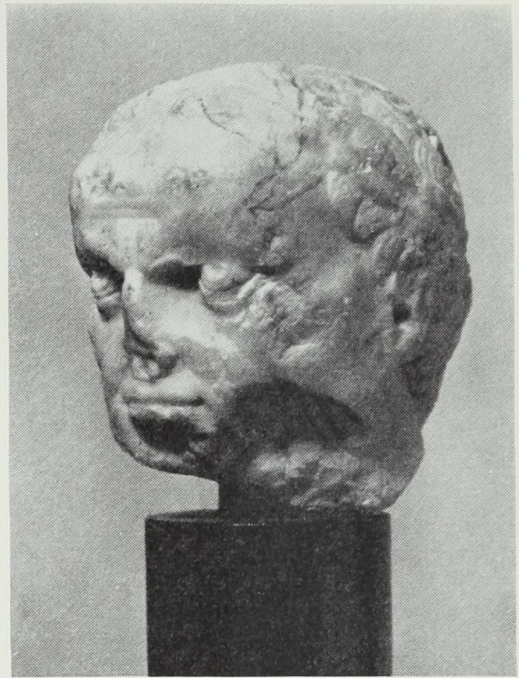
Fig. 3. Kejsler Galba(?). Alabasthoved i Nasjonalgalleriet, Oslo.

billede af selveste kejsler Diocletian (vor fortegnelse nr. 1). I forbindelse med Osloportrættet blev der til at begynde med henvist til en enkelt parallel, i museet i Autun (nr. 2), og først i 1953 og 1954 begyndte rækken at vokse med to af hinanden uafhængige publikationer af lignende alabasthoveder i London og i Leipzig, der pudsigt nok begge blev præsenterede som Constantius Chlorus, Constantin den Stores fader (nr. 5 og nr. 7).