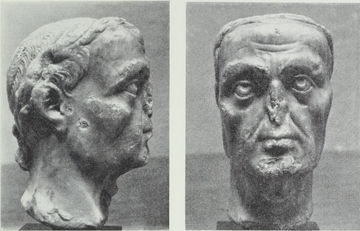
Fig. 4-5. Caius Julius Cæsar(?). Alabasthoved i British Museum London.