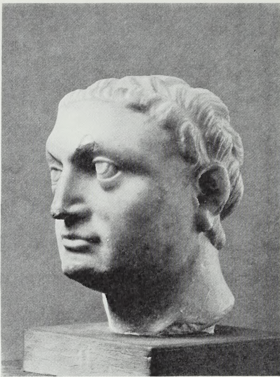
Fig. 2. Kejsler Otho. Alabasthoved i Thorvaldsens Museum.