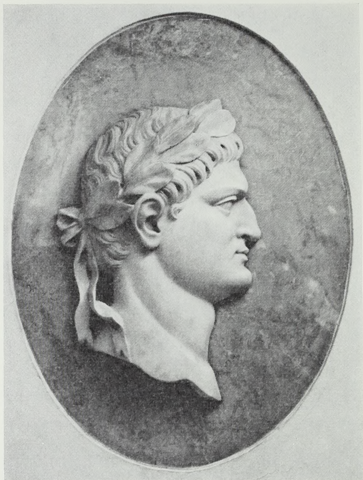
Fig. 8. Kejser Otho. Portrætmedaillon af marmor i Nationalmuseet.

at betegne dem som forfalskninger, for mange udmærkede kunstnere har i nyere tid på bestilling leveret romerske kejsere i deres eget navn. Velkendte er serierne i Palazzo Farnese, Palazzo Corsini og Villa Borghese i Rom; de borghesiske imperatorer er publicerede af Italo Falci i skulpturkatalogen fra 1954: Marmorportrætterne fra det 16. århundrede under nr. 48, de mange porfyrbuster fra det 17. århundrede under nr. 11. Her i København findes der et sæt marmorportrætter i relief af de tolv suetoniske kejsere, anbragt i forværelset til Nationalmuseets antiksamling (fig. 8); de ser ud til at være udført i slutningen af det 17.